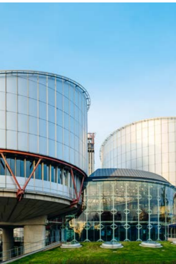
Europäischer Gerichtshof für Menschenrechte, Straßburg.