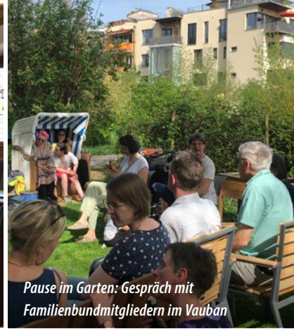
Pause im Garten: Gespräch mit Familienbundmitgliedern im Vauban