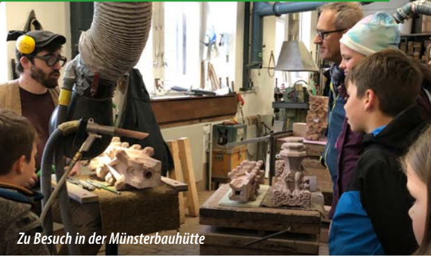
Zu Besuch in der Münsterbauhütte