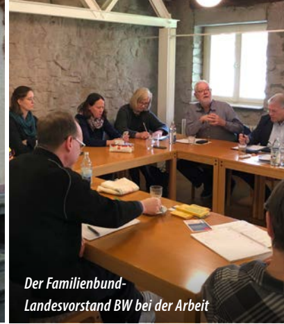
Der Familienbund-Landesvorstand BW bei der Arbeit