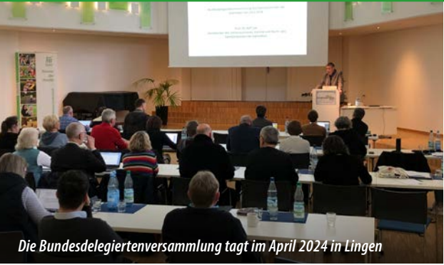
Die Bundesdelegiertenversammlung tagt im April 2024 in Lingen