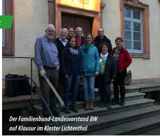
Der Familienbund-Landesvorstand BW auf Klausur im Kloster Lichtenthal