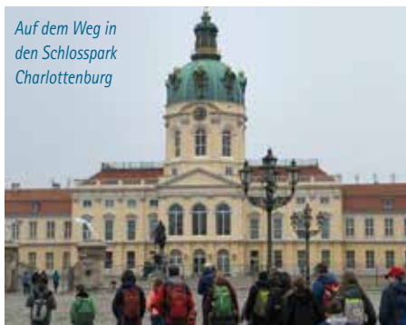
Auf dem Weg in den Schlosspark Charlottenburg

Charlottenburg erlebten wir Gemeinschaft, lernten uns besser kennen, wurden sportlich aktiv, stellten kreative Baumkunst her und übten uns in Familien-Demokratie. Und während die Kinder