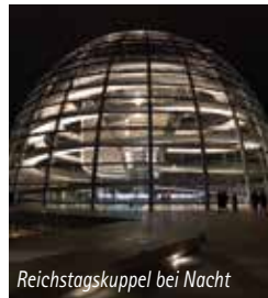
Reichstagskuppel bei Nacht

Und wer damit noch nicht genug hatte, konnte sich im Parlamentshistorischen Museum doch noch in einen Abgeordnetensessel setzen.