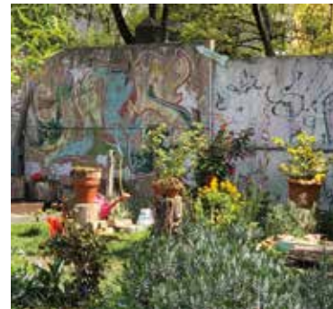
Berührend: Gemeinschaftsgarten im einstigen Todesstreifen