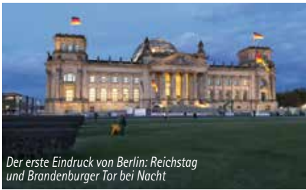
Der erste Eindruck von Berlin: Reichstag und Brandenburger Tor bei Nacht