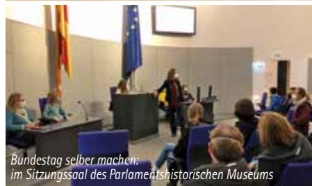
Bundestag selber machen: im Sitzungssaal des Parlamentshistorischen Museums