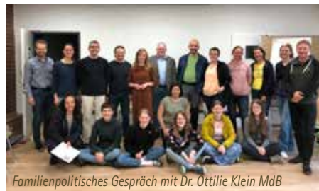
Familienpolitisches Gespräch mit Dr. Ottilie Klein MdB