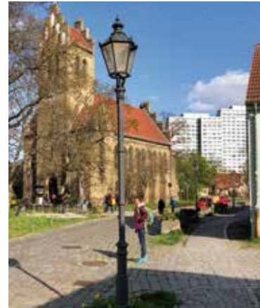
Berlin mal anders: Miteinander von dörflicher Idylle und Plattenbauten im Stadtteil Marzahn

Atmosphäre und Miteinander waren prima, neue Freundschaften wurden geschlossen. Und als wäre das nicht schon genug, hat der Familienbund auch noch neue Mitglieder und Kontakte zu jüngeren Familien gewonnen.