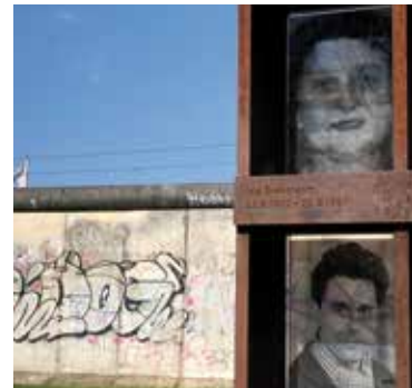
Ergreifend: die Gedenkstätte Berliner Mauer an der Bernauer Straße

Die Fahrt hat uns alle begeistert und die Erinnerung daran wird noch lange lebendig bleiben.